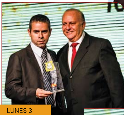
LUNES 3 TECNOLOGIAS DE IMPRESSÃO