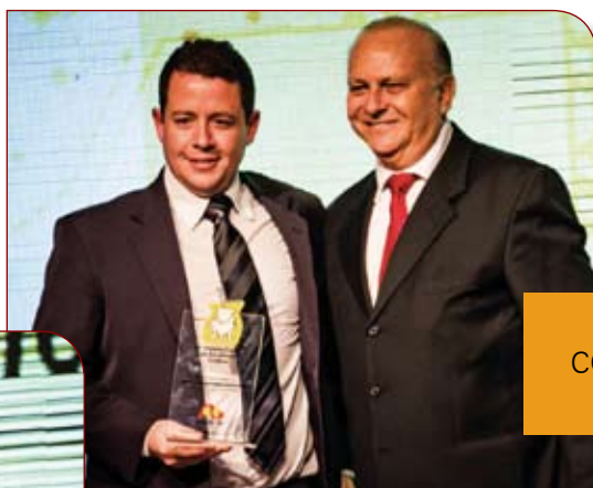
PERFIL CONSULTORIA GRÁFICA