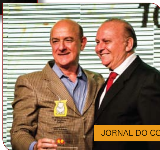
JORNAL DO COMÉRCIO